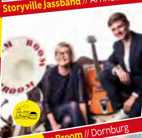
Boom Boom Broom // Dornburg