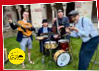
Die Kleine Swingbrause // Braunschweig

Musik und Rhythmus finden ihren Weg zu den geheimsten Plätzen der Seele. (Platon)