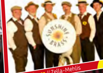
Sunshine Brass // Zella-Mehlis