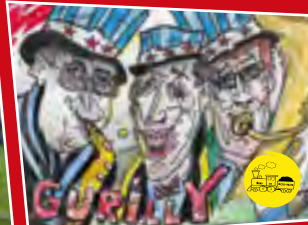
Combo Gurilly // Erfurt